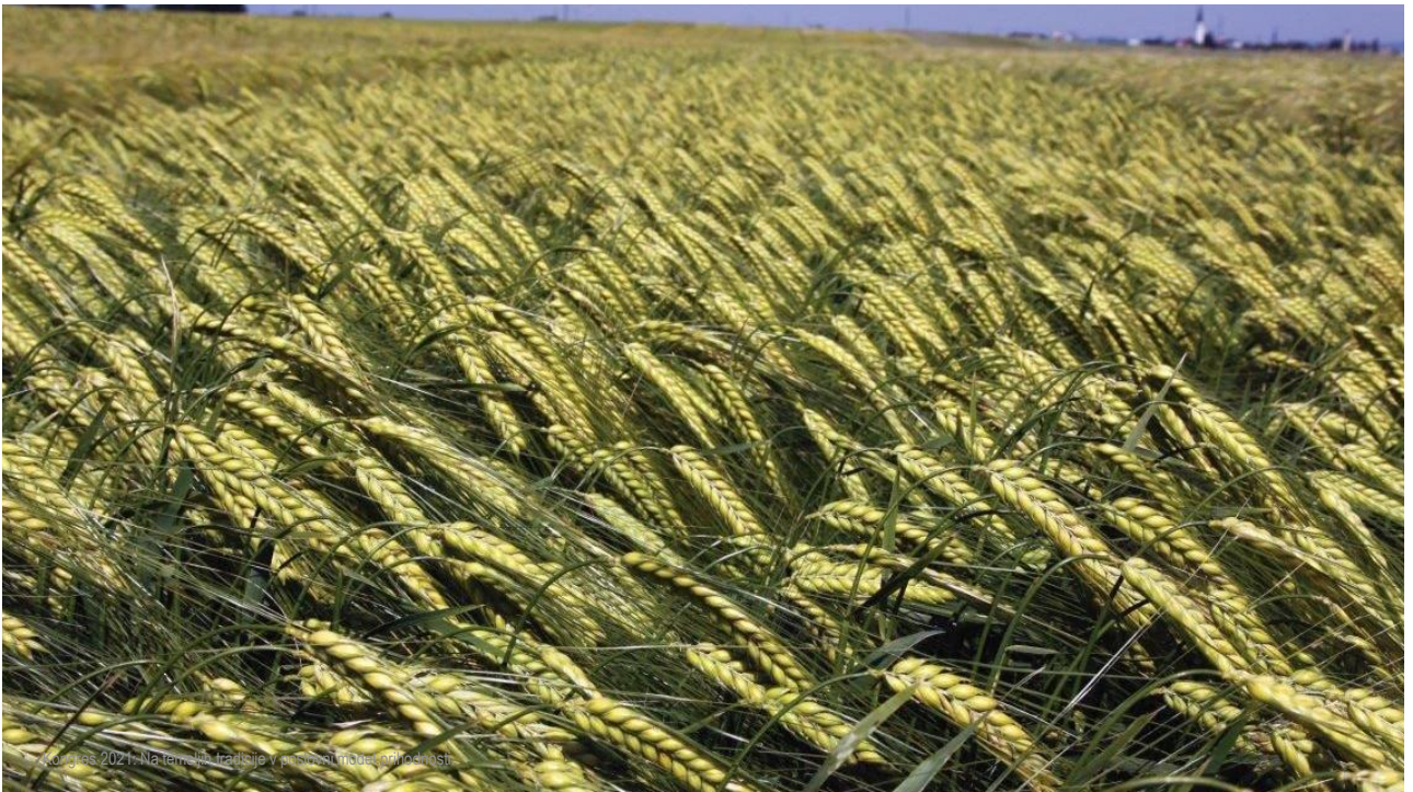
Agropolis 2021: Na teme štátna tradície v súčasnej úlohe a možnosti.